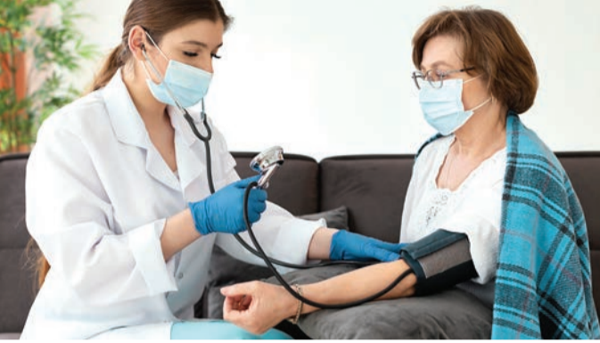
दीवारों पर बनता है, यह दबाव ही ब्लड प्रेशर कहलाता है।

ब्लड प्रेशर को जानें : जब दिल खून को पंप करता है, तो इसका दबाव धमनियों की दीवारों पर बनता है, यह दबाव ही ब्लड प्रेशर कहलाता है। सिस्टोलिक प्रेशर में दिल सिकुड़ता है। यह ब्लड प्रेशर का ऊपर का नंबर है। जब दिल दो धड़कनों के बीच आराम करता है, तो नीचे का नंबर या डायस्टोलिक प्रेशर बनता है। एक सामान्य रीडिंग आमतौर पर 120/80 एमएम एचजी से कम होती है, जबकि हाई ब्लड प्रेशर या हाइपरटेंशन 130/80 एमएम एचजी उससे ज्यादा होती है। हाई ब्लड प्रेशर में ब्लड का दबाव लगातार बहुत अधिक रहता है, जिससे धमनियों को नुकसान हो सकता है। लंबे समय तक ऐसा रहने पर स्ट्रोक, किडनी और दिल की बीमारी जैसी गंभीर समस्याएं हो सकती हैं।