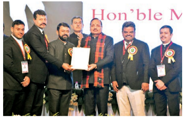
सीजेआई जस्टिस सूर्यकांत का स्वागत करते मुख्यमंत्री नारायण चौधरी। जिला बार एसो. के कार्यक्रम में पहुंचे चीफ जस्टिस को सम्मानित करते पदाधिकारी।