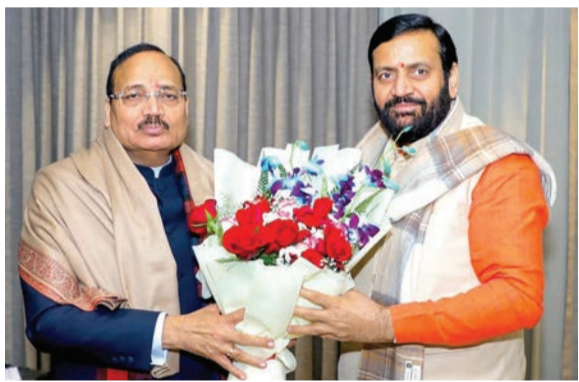
सीजेआई जस्टिस सूर्यकांत का स्वागत करते मुख्यमंत्री नारायण चौधरी। जिला बार एसो. के कार्यक्रम में पहुंचे चीफ जस्टिस को सम्मानित करते पदाधिकारी।

बरवाला/नारनौंद हिंसा (राजधानी चौपाल) | देश के सीजेआई सूर्यकांत ने कहा कि ज्यूडिशियरी कोर्ट कॉम्प्लेक्स की इमारतें तो बन जाएंगी, लेकिन वे तभी सफल होंगी, जब उनमें न्याय का खून दौड़े और गरीब का दर्द समझने की क्षमता हो। वे शनिवार को बरवाला और नारनौंद पहुंचे। यहां नवस्थापित कोर्ट का उद्घाटन किया और न्यायिक परिसर का शिलान्यास किया। वहीं, बरवाला में पर्यावरण संरक्षण का संदेश देते हुए पीथरोपण भी किया।